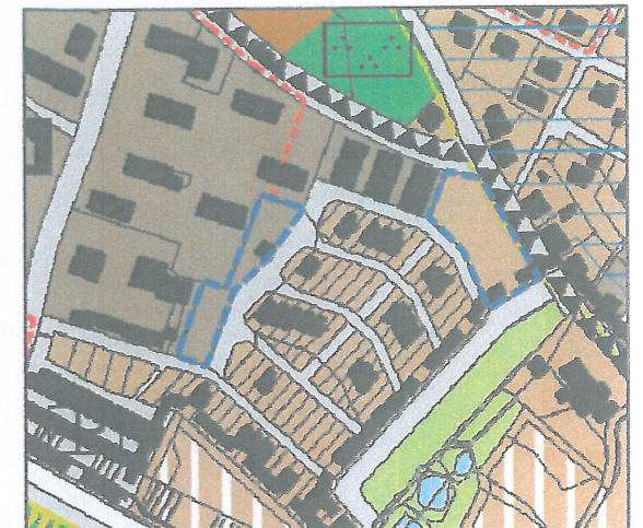
wyciąg z ustaleń studium uwarunkowań i kierunków zagospodarowania przestrzennego miasta Kowary (Uchwała Nr XXIV/139/2000 Rady Miejskiej w Kowarach z dnia 30 października 2000r. ze zmianami) granicze obszarów objętych planem