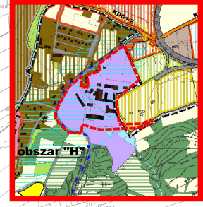
wyciąg z rysunku studium uwarunkowań i kierunków zagospodarowania przestrzennego miasta Kowary (Uchwała Nr XXIV/139/2000 Rady Miejskiej w Kowarach z dnia 30.10.2000r. - za zmianami)

STAROSTA JELEŃCZĄCZYŃSKI Powiatowy Urząd Geodezyjno-Kartograficzny w Jeleniej Górze Przebieganie, rozpoznanienie i wytyczenie granic strefy "OW" obserwacji archeologicznej w planie miejscowym w skali 1:1000 - Plan zagospodarowania przestrzennego (Dz. U. nr 34, poz. 123 z późniejszymi zmianami). Jelenia Góra, dnia 27 VII 2013 r. STAROSTA JELEŃCZĄCZYŃSKI Powiatowy Urząd Geodezyjno-Kartograficzny w Jeleniej Górze Przebieganie, rozpoznanienie i wytyczenie granic strefy "OW" obserwacji archeologicznej w planie miejscowym w skali 1:1000 - Plan zagospodarowania przestrzennego (Dz. U. nr 34, poz. 123 z późniejszymi zmianami). Jelenia Góra, dnia 27 VII 2013 r. GEODETA Agencja Usługowa