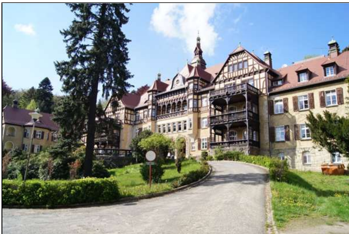
Rysunek 9. Szpital Wysoka Łąka