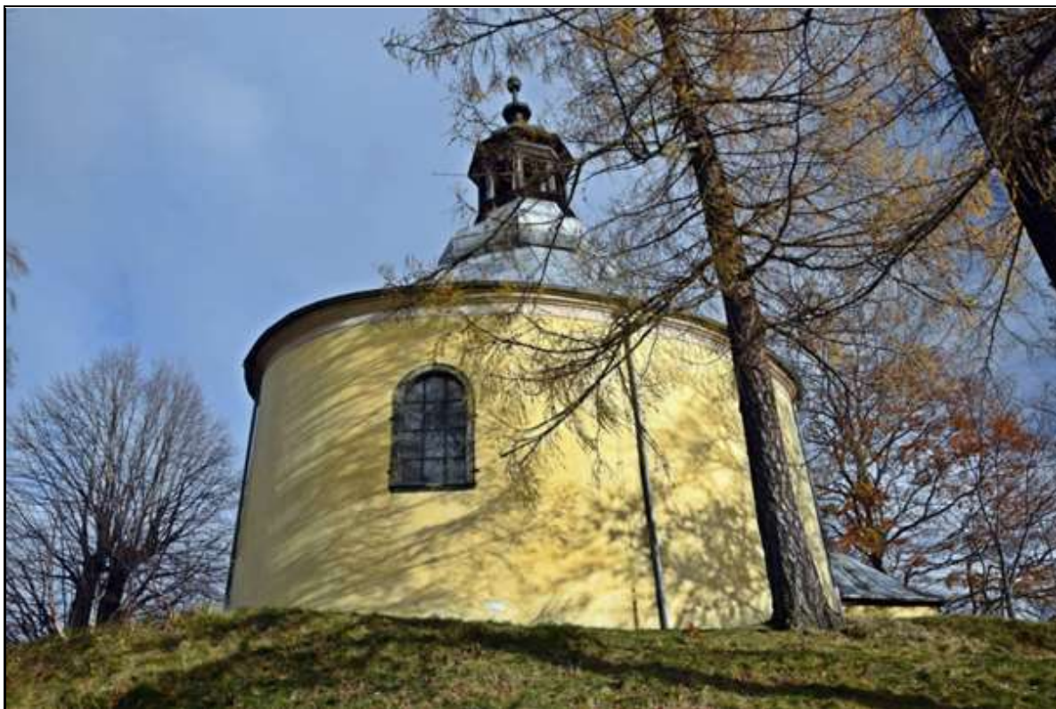
Rysunek 6. Kaplica św. Anny w Kowarach