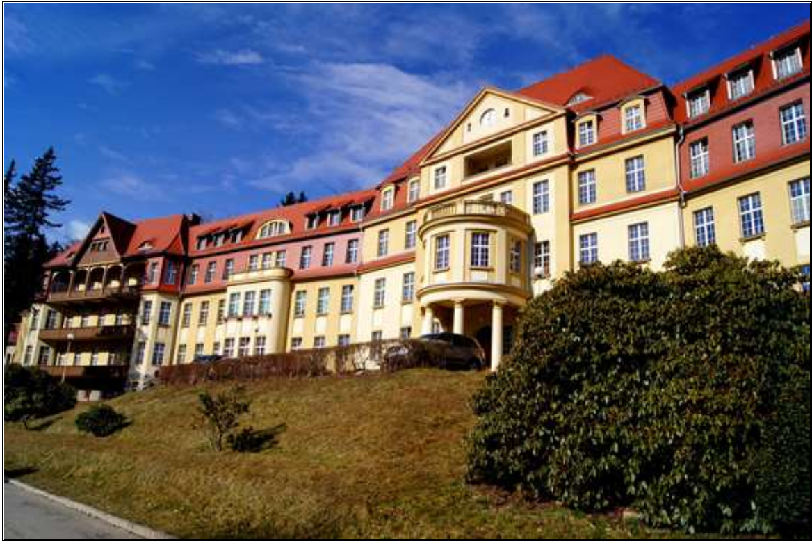
Rysunek 8. Szpital "Bukowiec" w Kowarach