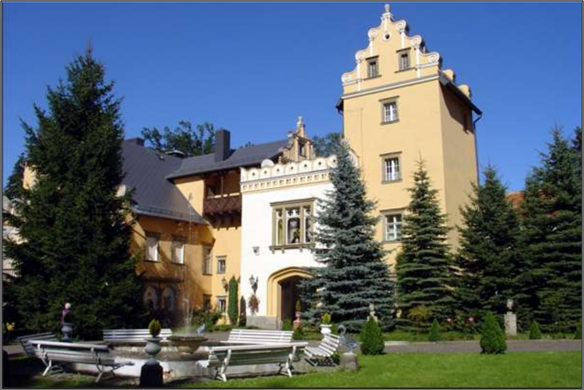
Rysunek 12. Pałac Nowy Dwór