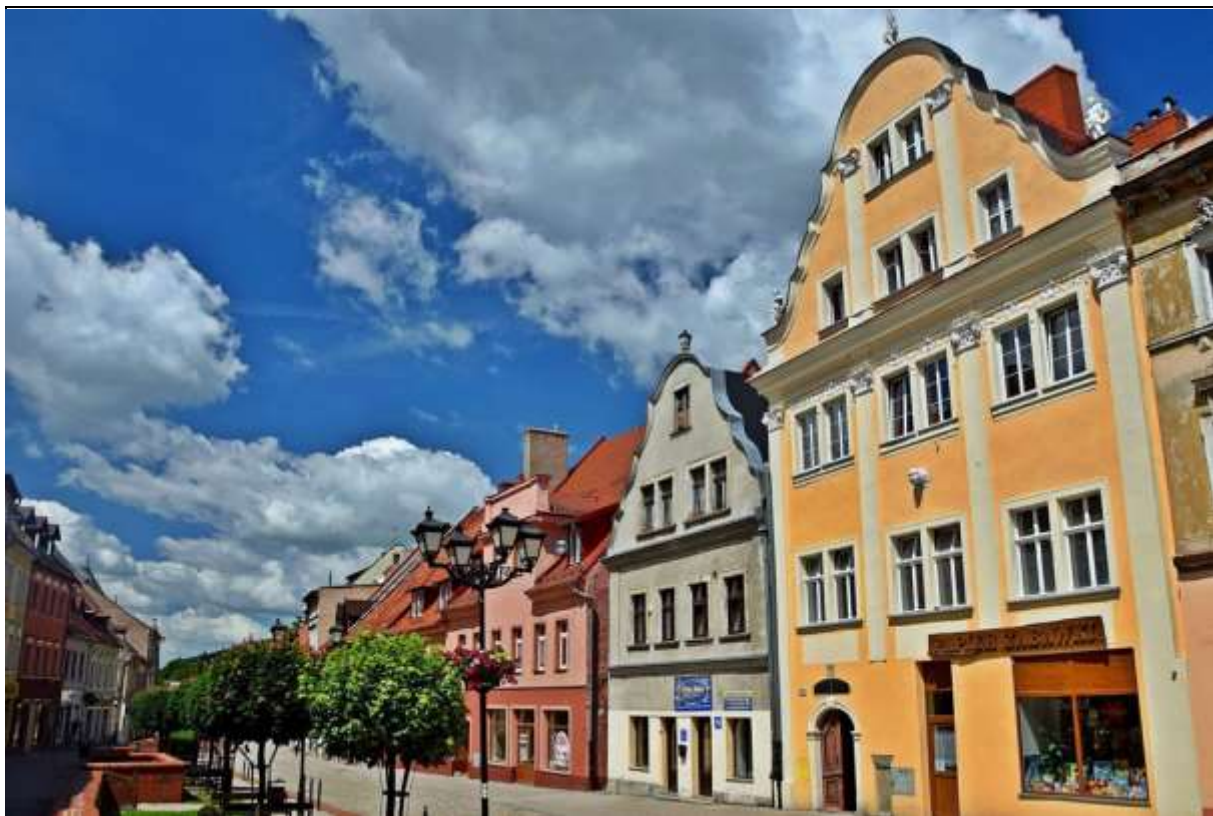
Rysunek 4. Kowarska Starówka

Miasto – układ urbanistyczny – w centrum miasta - obszar starego miasta znajduje się Kowarska Starówka. Składa się z ciągów zabytkowych kamienic, które powstały pod wpływem budownictwa propagowanego na Śląsku na przełomie XVIII i XIX wieku. Najbardziej charakterystyczne budynki stoją przy ulicy 1 Maja. Część z budynków wybudowana została w stylu barokowym i styl ten zachował się do dziś. Pozostałe budynki budowano w stylu klasycystycznym. Obecnie część Kowarskiej Starówki stanowi deptak. 23