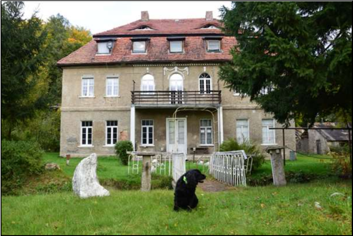
Rysunek 11. Zespół pałacowo-parkowy „Ciszyca”