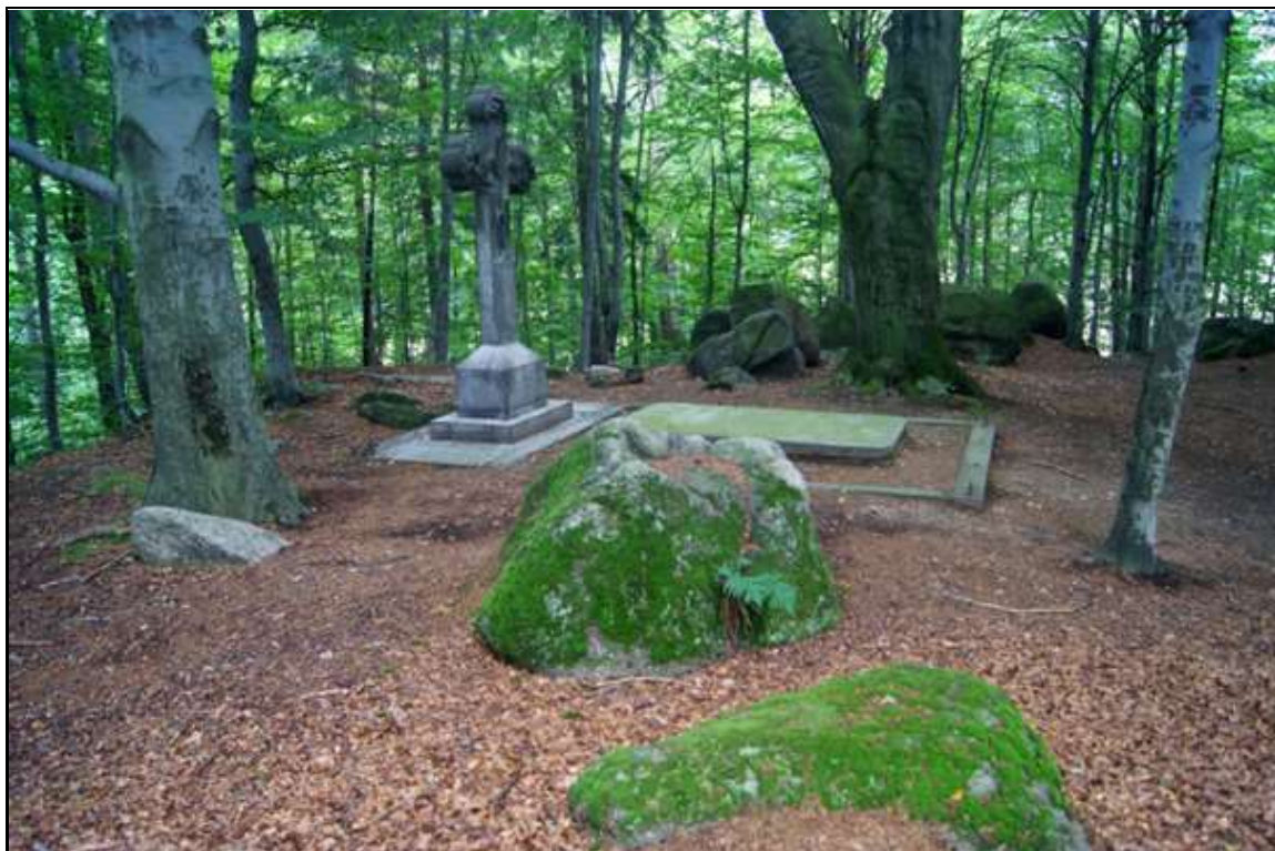
Rysunek 13. Grobowce rodziny von Reuss