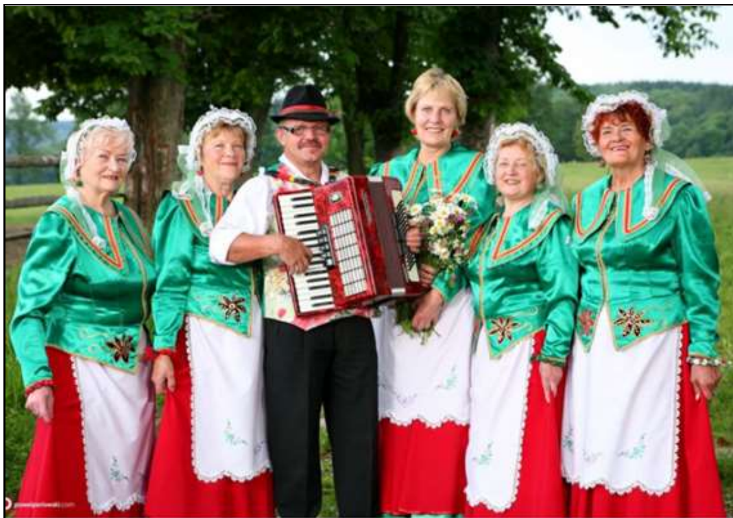
Rysunek 3. Zespół "Kowarskie Wrzosey" w lokalnym stroju