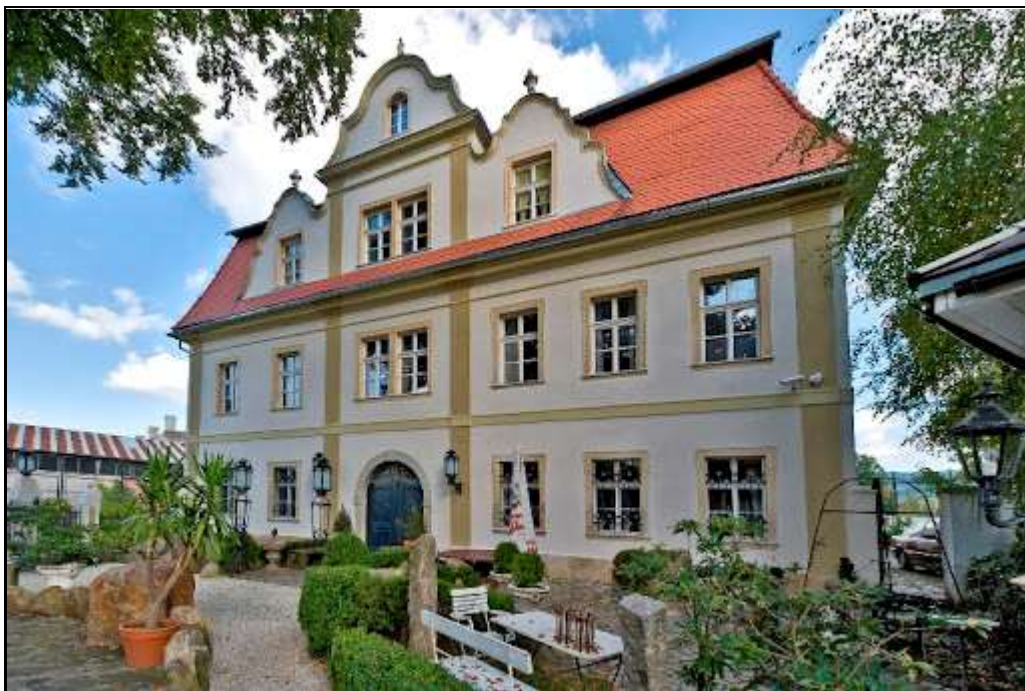
Rysunek 10. Pałac „Smyrna”