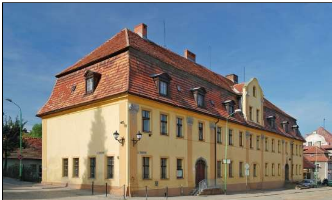
Rysunek 7. Plebania

Plebania – budynek znajduje się na placu Franciszkańskim, w sąsiedztwie kościoła pw. Najświętszej Marii Panny. Jego powstanie datuje się na lata 1779-1783. Plebania powstała w stylu barokowym, a fasada budynku wpisuje się w styl rokoko.