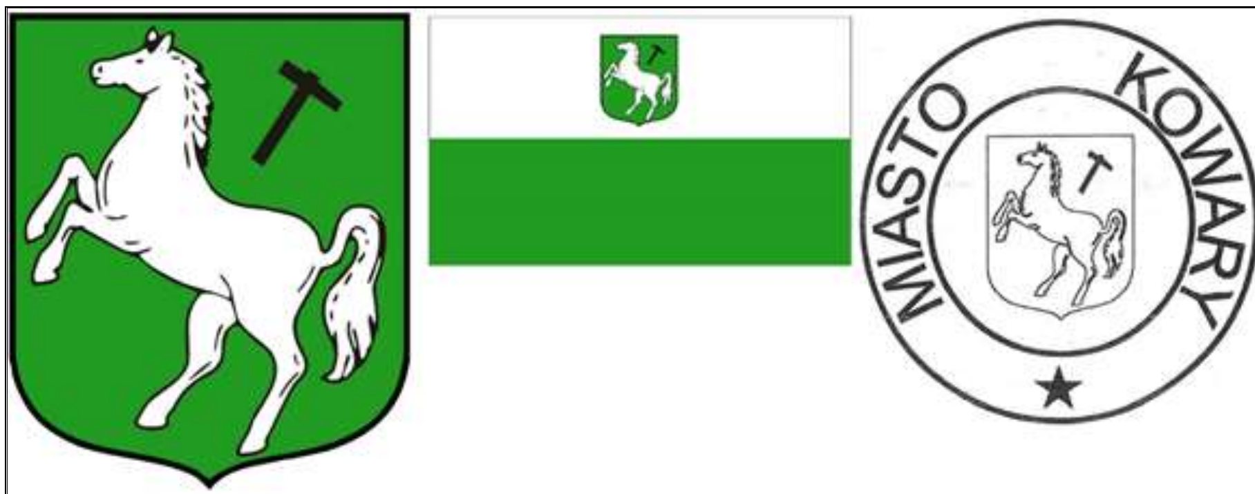
Rysunek 1. Herb, flaga oraz pieczęć Miasta Kowary