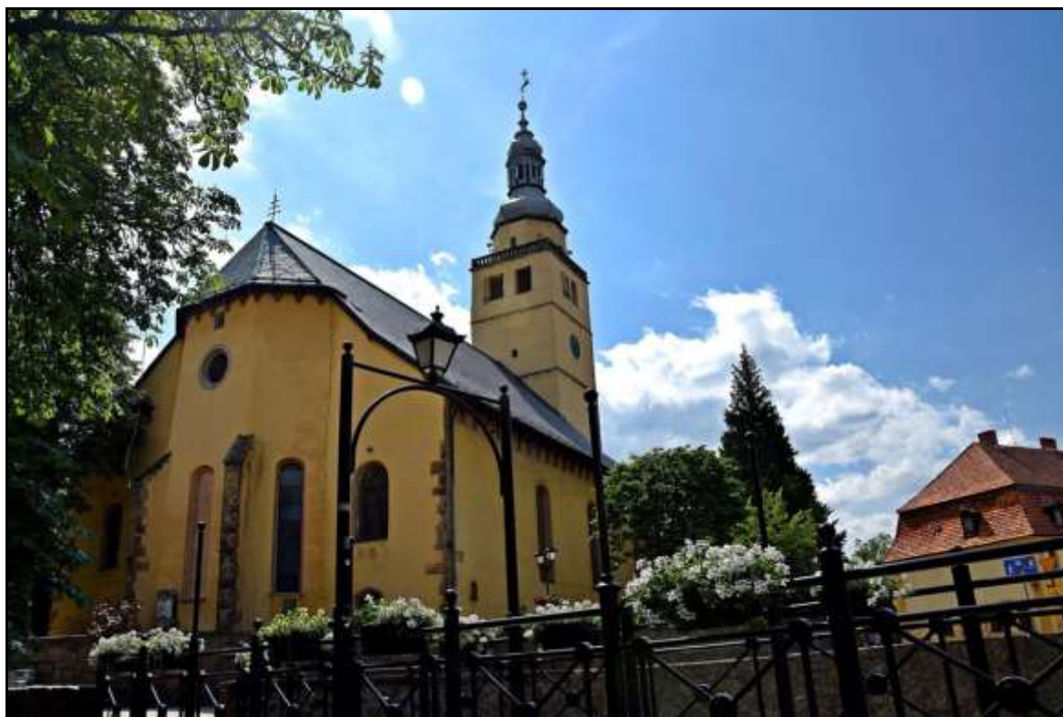
Rysunek 5. Kościół parafialny NMP w Kowarach