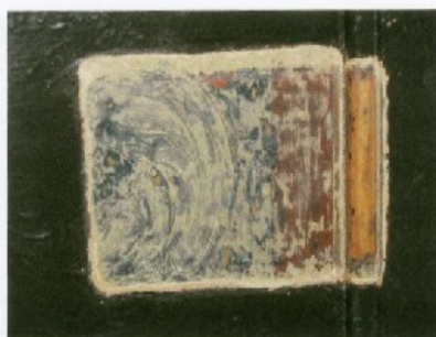
- odkrywka na płycinach drzwi w holu

Wykonane odkrywki schodkowe wykazały istnienie kilku warstw stratygraficznych, z których najstarszą wydaje się dobrze zachowana warstwa o kolorystyce jasnego brązu – „ruda”. Dalsze sondy pozwolą uściślić jej zasięg i chronologię oraz czy występuje ona na wszystkich detalach klatki schodowej.