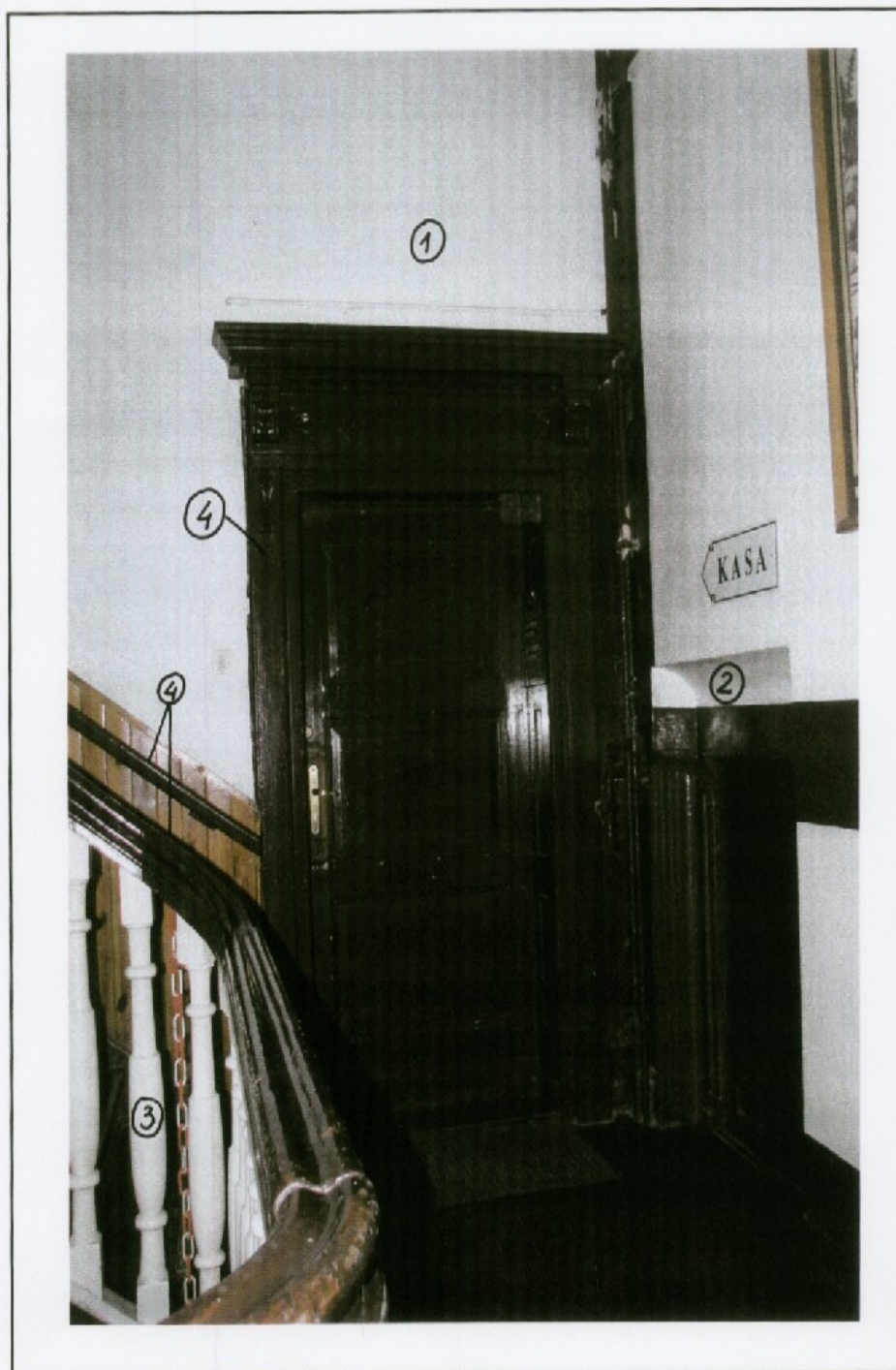
Fotografia wnętrza klatki schodowej z naniesionymi numerami wg tabeli kolorów