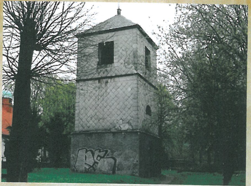
Dzwonnica stojąca przy wejściu na cmentarz komunalny w Kowarach, pozostałość po kompleksie ewangelickim